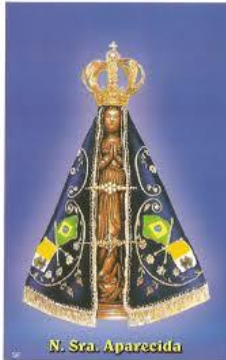
N. Sra. Aparecida